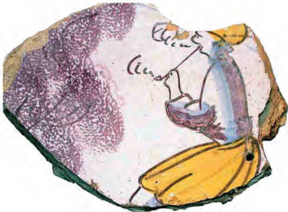
Afb. 6. Schotel (fragment), majolica, Friesland(?), Nederland, voor 1700. Pijprokende man in geel en paars. Bodemvondst Bergen, Noorwegen. (Privé collectie, R. Dunlop / N. Mehler, Knasterkopf 2004 (17). Website www.knasterkopf.de/hm/hmd17.htm )