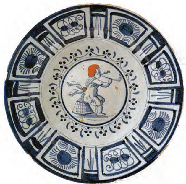
Afb. 4. Schotel, majolica, Nederland, 1630-1640, D. 23 cm. Pijprokende putti in oranje en blauw.

Een nieuw ontwikkelde techniek, namelijk het bakken van borden en schotels in cilinders bracht uitkomst. In deze kokers, gemaakt van gebakken aardewerk, waren een aantal driehoekige uitsparingen aangebracht waar driehoekige gebakken aardewerk pennen doorheen konden worden gestoken. Elk bord dat moest worden gebakken rustte nu met de achterkant op drie van zulke pennen. Het voordeel was dat elk bord nu allen zijn eigen gewicht moest dragen en dus een