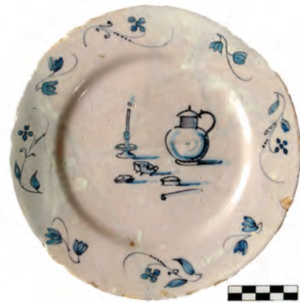
Afb. 11. Bord, faïence, Delft, Nederland, laat 17de eeuw, D. 19,5 cm. Stilleven met rookpijp, tabaksdoos, comfort, kandelaar en wijnkan in blauw. Bodemvondst Amsterdam. (Collectie Ron de Haan, foto Wiard Krook)

Sommige publicaties verwijzen naar de Zuid-Amerikaanse stad Varinas als plaats van herkomst van deze tabak. In de twintigste eeuw gebruikte Van Nelle de naam 'Varinas' als merknaam voor haar pijptabak. Een moderne variant is een geschenkartikel in het Rotterdam Museum van de Tabaksfabriek Van Rossem uit 1960.