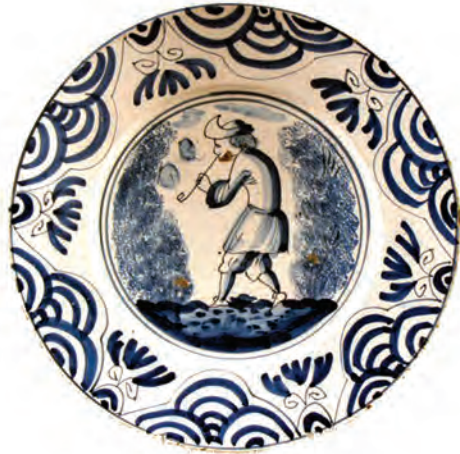
Afb. 8. Schotel (fragment), faience, Nederland, 1675-1725, D. 30,7 cm. Wandelende pijprokende man in blauw. Bodemvondst. (Collectie Ottema-Kingma Stichting, Keramiekmuseum Prinsessehof, Leeuwarden,)