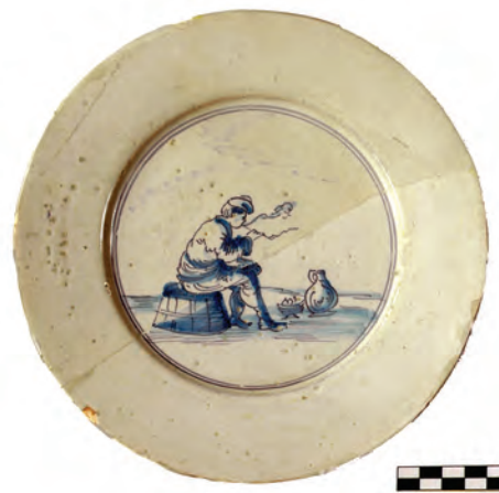
Afb. 10. Bord, faience, Delft, Nederland, laat 17de eeuw, D. 19,5 cm. Zittende pijprokende man in blauw. Bodemvondst Amsterdam. (Collectie Ron de Haan, foto Wiard Krook)