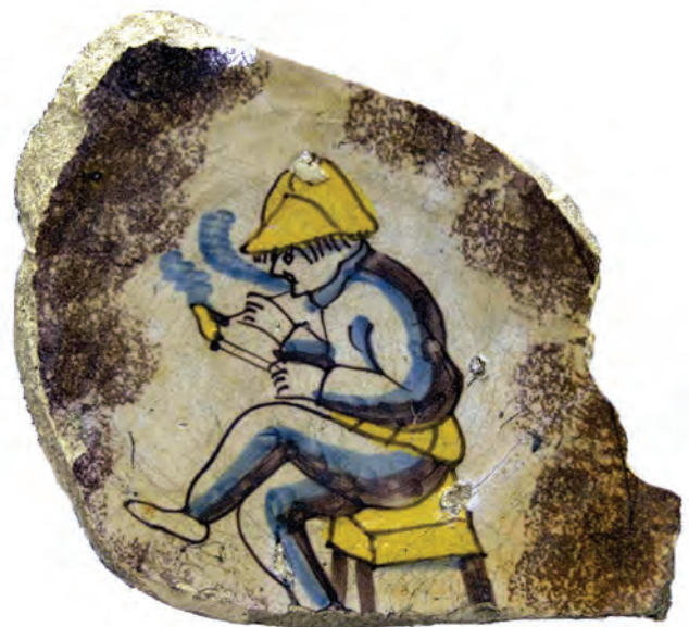
Afb. 2. Schotel (fragment), majolica, Nederland, 1670-1700, D. 16,5 cm. Zittende pijprokende man met vuurstokje in geel, blauw en zwart. Bodemvondst Hoorn. (, inv. nr. PK 21.613)

Onder de categorie 'dagelijks leven' mogen we de rokende figuren rekenen. De oudste rokers die we op majolica borden aantreffen zijn mannetjes die zittend op een krukje vredig van hun pijpje genieten (afb. 1 en 2). Mogelijk kan een schilderij van een rokende boer van Adriaen Brouwer (1605-