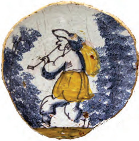
Afb. 5. Schotel (fragment), majolica, Friesland(?), Nederland, 1660-1700, D. 18 cm. Wandelende pijprokende man in geel en blauw. Bodemvondst Leeuwarden.