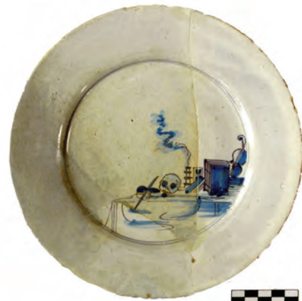
Afb. 12. Bord, faïence, Delft, Nederland, laat 17de eeuw, D. 20,2 cm. Stilleven met doodshoofd, Bijbel en viool in blauw. Bodemvondst Amsterdam. (Collectie Ron de Haan)