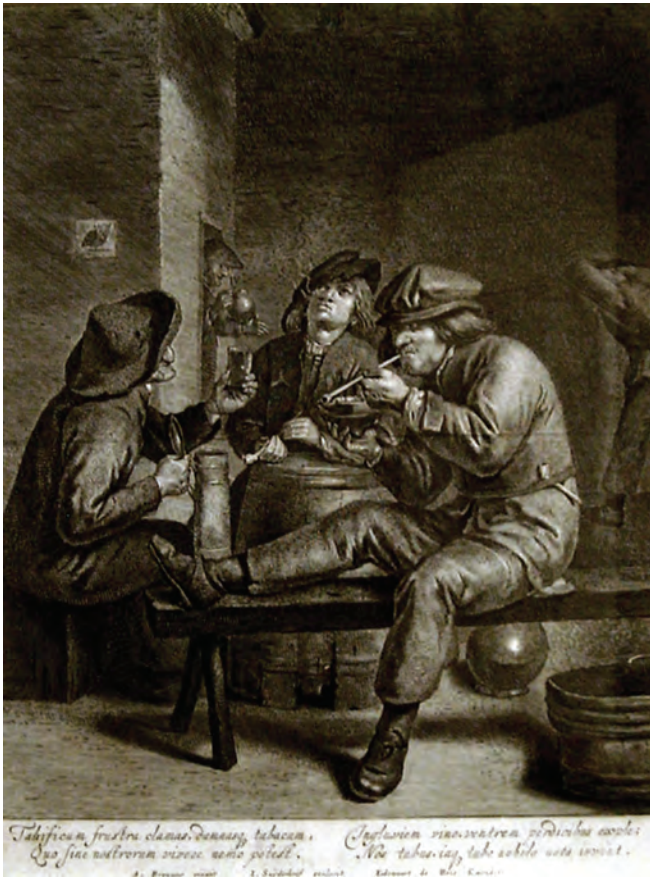
Afb. 3. Ets 'Drie boeren in een interieur' van Jonas Suyderhoef (1613-1686) naar een schilderij van Adriaen Brouwer (1605-voor 1638).

voor 1638) als inspiratiebron gediend hebben. Afbeelding 3 toont de ets 'Drie boeren in een interieur' van Jonas Suyderhoef (1613-1686) die hij naar een schilderij van Brouwer maakte. Onder de ets staat de volgende wijsheid (vertaald uit het Latijn): 'Tevergeefs bestempel en veroordeel je als teringverwekkend de tabak, zonder welke niemand van ons kan leven. Vul je keel met wijn, je maag met patrijzen; de pijp en de daaruit voortkomende rookwolken geven ons genot.'